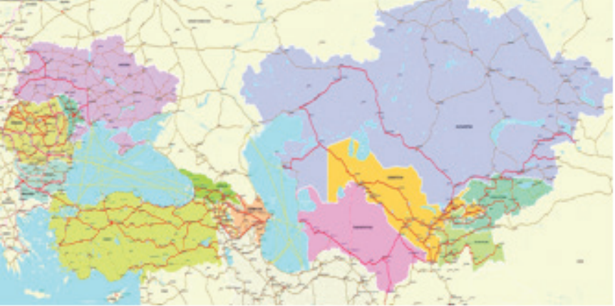
Harita 2. TRACECA Programındaki Karayolları Güzergahı